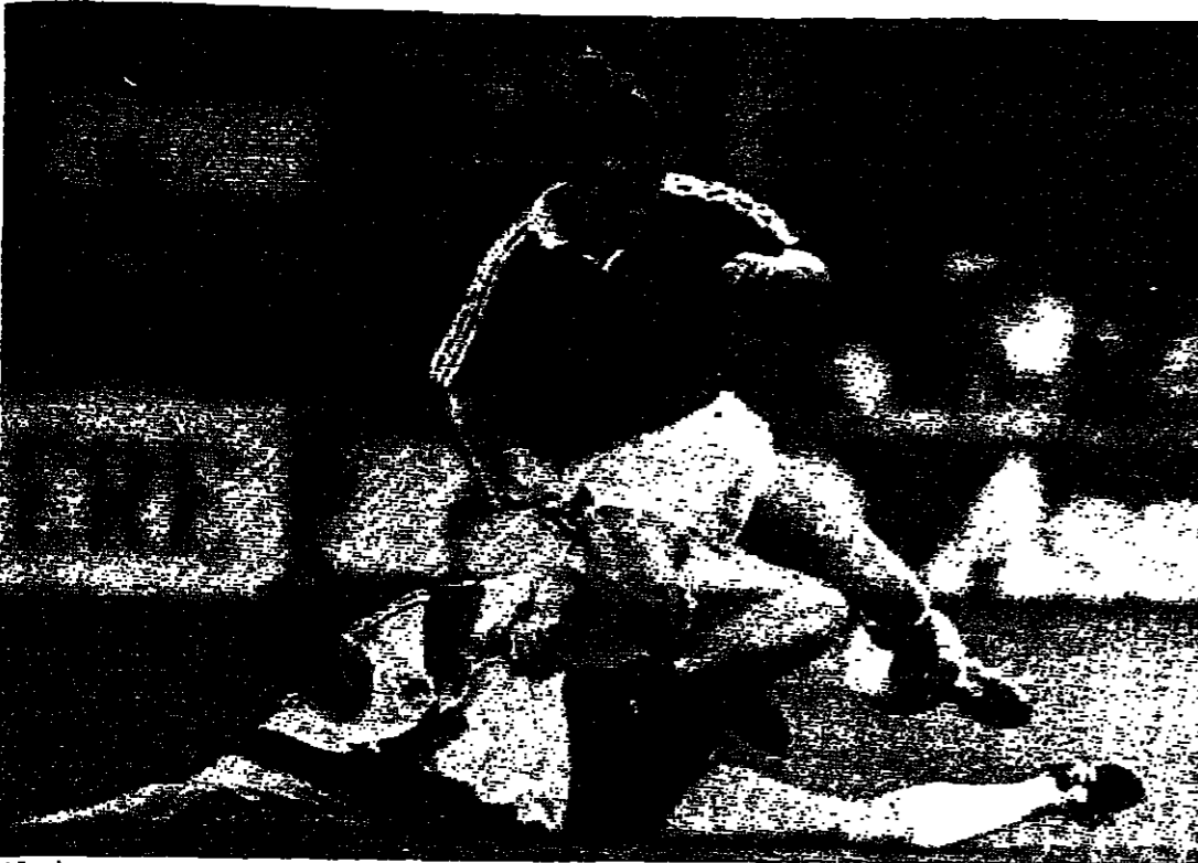
ستيفن رويتر يتصدى لريشارد فيتشيه